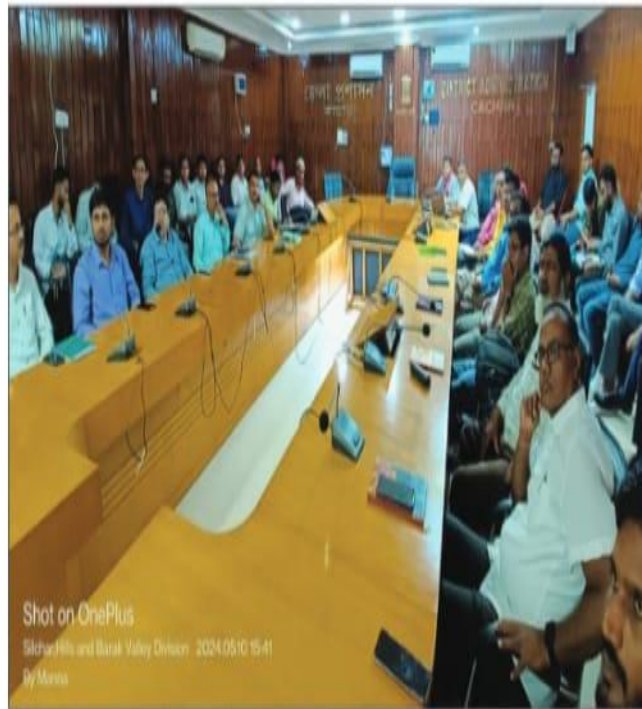
Officials of the Cachar district administration and the District Disaster Management Authority (DDMA) at the review meeting on flood preparedness held at the conference hall of Cachar DC.